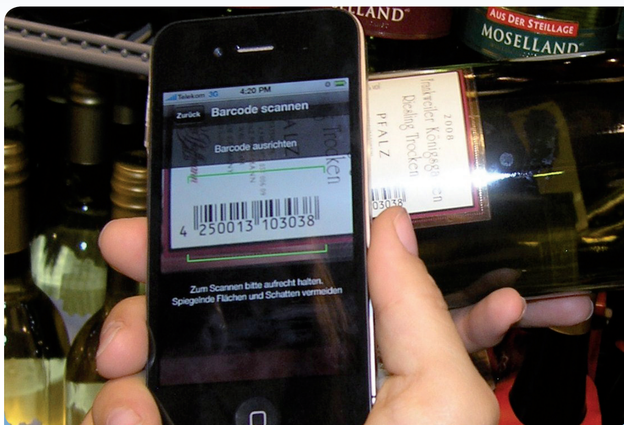
Weinberater - Mehr Informationen zum Wein mobil aufs Smartphone

Binden Sie Ihre Kunden an sich, indem Sie mehr bieten: Mehr Beratung, mehr Information, mehr Service - mobil und schnell direkt auf das Smartphone Ihrer Kunden.